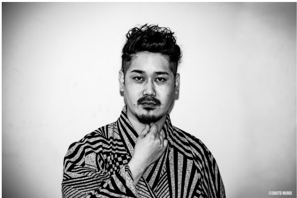
スチールサンプル