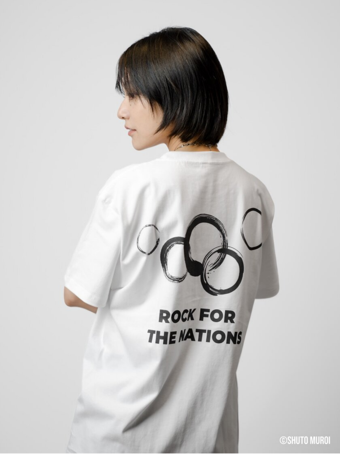
アパレル撮影サンプル