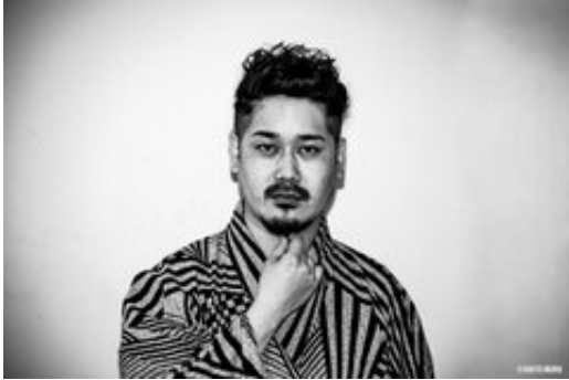
スチールサンプル