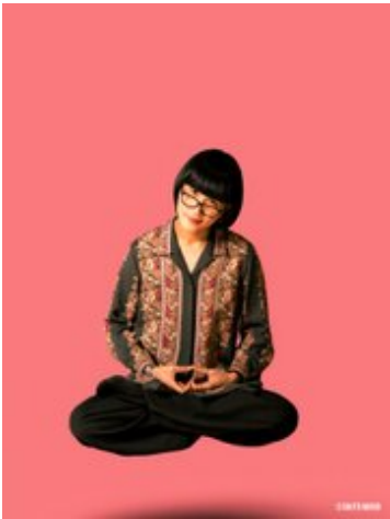
宣材写真サンプル(moruta)