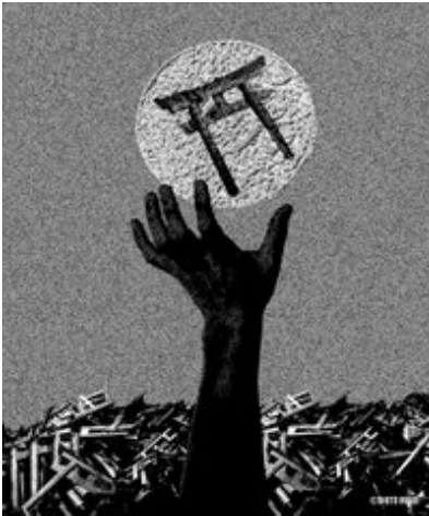
MVVO Art 2024 AD Art Show