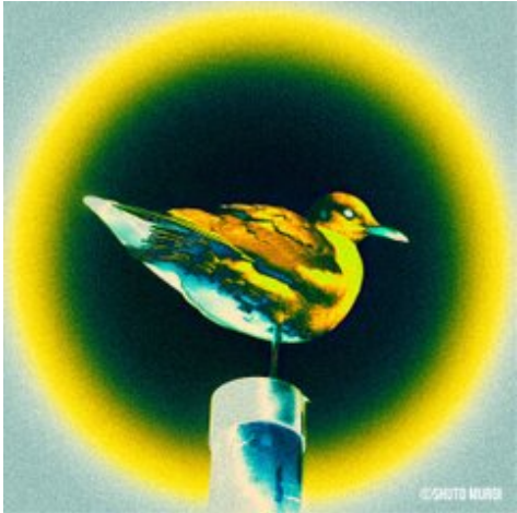
Apa award 2026 写真部門