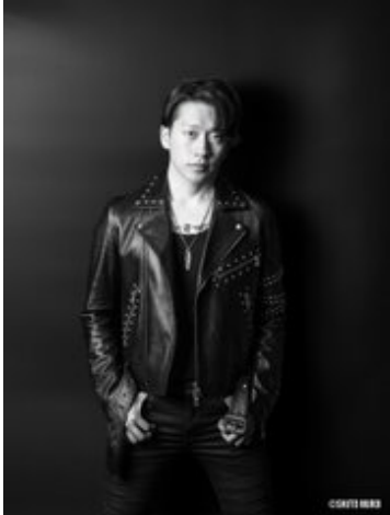
宣材写真サンプル(JINN)