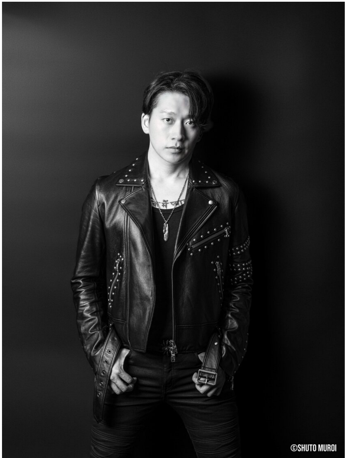
宣材写真サンプル(JINN)