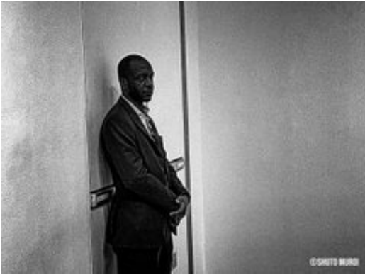
第58回Canon Photo Contest web部門