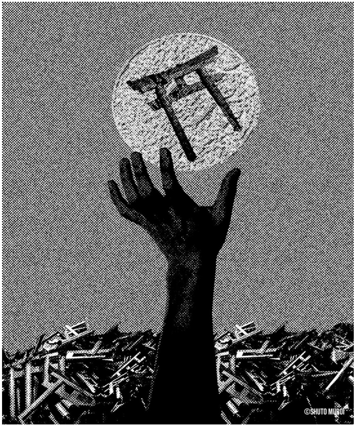
MVVO Art 2024 AD Art Show