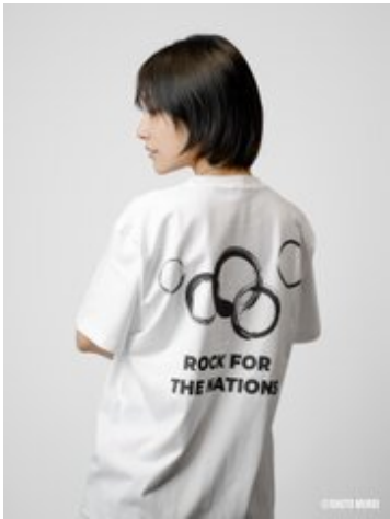
アパレル撮影サンプル